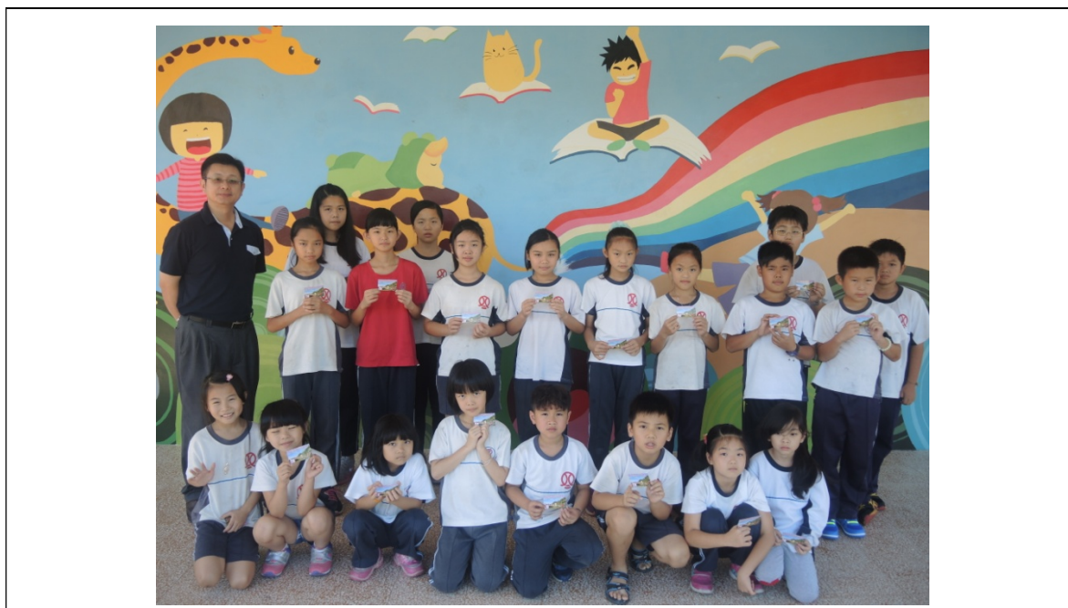
圖片說明：閱讀心得寫作表揚