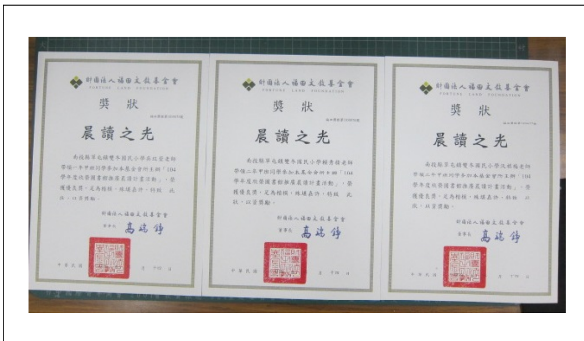
圖片說明：1-3 年級晨讀之光獎狀