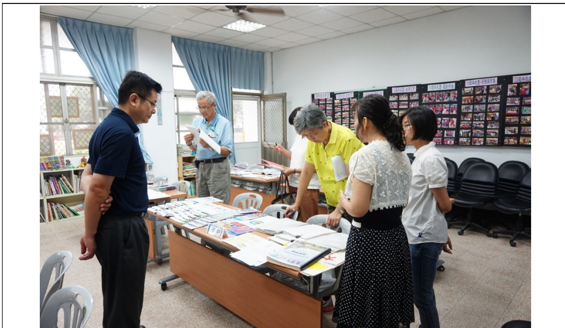
圖片說明：評委們檢核資料情形