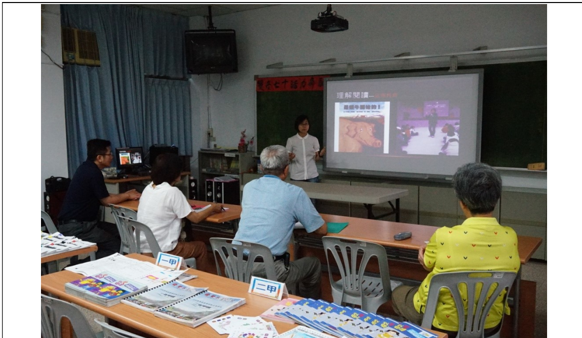
圖片說明：本校推動晨讀情形之簡報說明