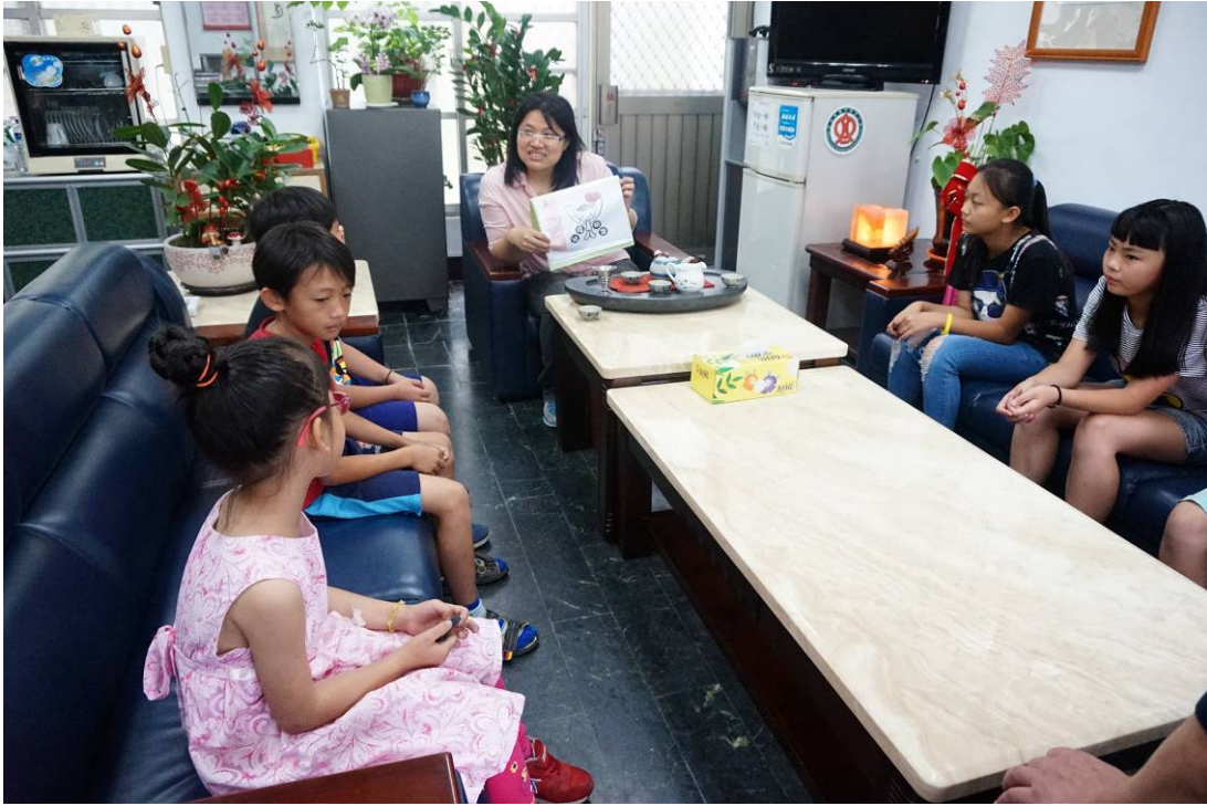
引進兒童福利聯盟資源到校，對弱勢生進行家庭關懷與經濟補助